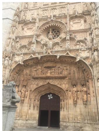
L'entrée du château de Coca & la porte du couvent Saint Benoît à Valladolid