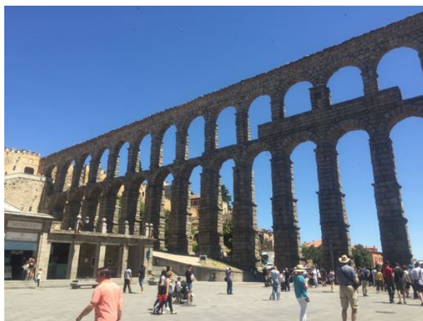
Le château de Manzanares el Real & L'aqueduc de Segovie