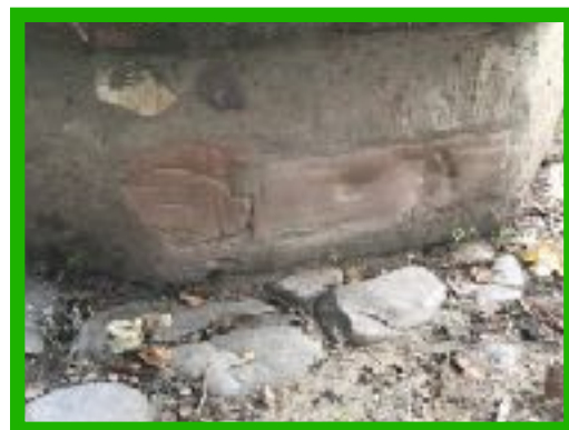
Empreinte du pied de Sigeric et d'un poisson au bas d'une colonne (d'après Danillo)

Les chiffres souvent avancés par les associations et les fédérations se situent autour de 5000 pèlerins par an qui réalisent tout mais le plus souvent une partie de la Via Francigena à pied ou en vélo.