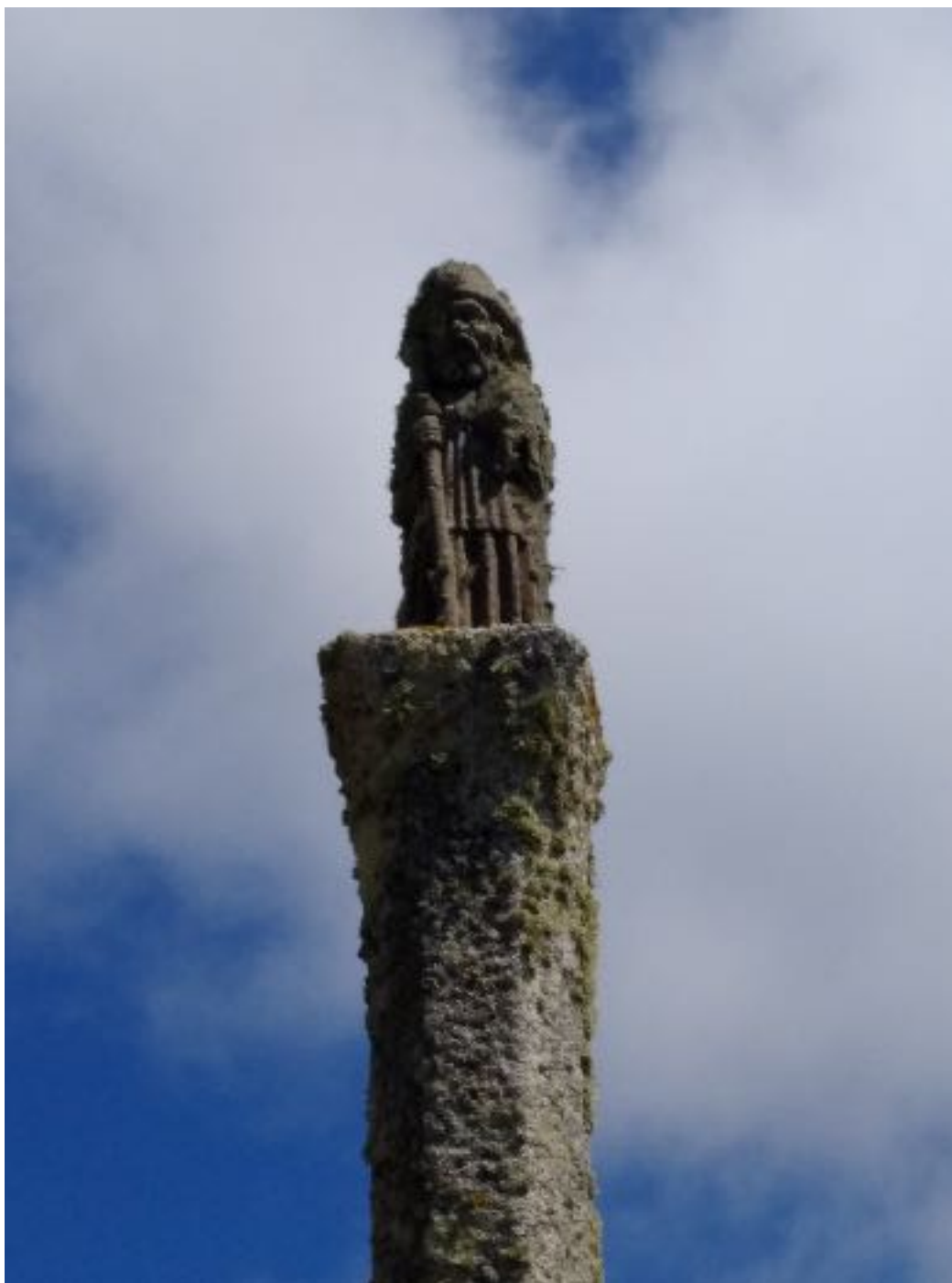
Statue de saint Jacques à la pointe du Van sur le GR 34