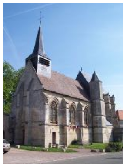
Eglise St Jacques de Folleville

Nous avons malheureusement retrouvé sur le parcours des marques réalisées à la peinture fluorescente verte ou fuchsia ne correspondant absolument pas à la charte de balisage adoptée entre les Fédérations françaises de randonnée pédestre (FFRP) et des amis des Chemins de Compostelle (FFACC). Nous ne connaissons pas la personne qui intervient de la sorte sans aucune autorisation et en ne respectant pas les règles du balisage. Nous espérons que ces interventions intempestives cesseront pour le bien de tous !