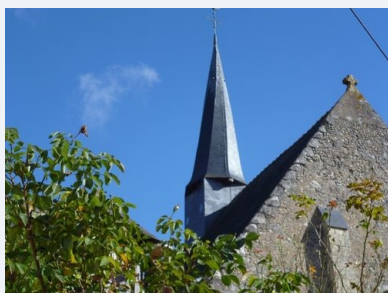
Église Saint Médard, Reugny