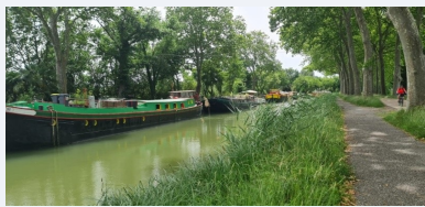
Le Canal du Midi

Avec le retour des beaux jours, vous êtes plusieurs dizaines d'adhérents de Compostelle Nord partis sur le Chemin. Quelques uns d'entre vous ont donné ou donnent encore de leurs nouvelles, jouant le jeu de cette nouvelle rubrique. Partageant ainsi avec tous, en quelques lignes, vos impressions, une anecdote, voire un coup de cœur, une joie ou une galère avec parfois photos à l'appui. Extraits.