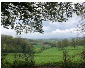
Mont des Cats 11 juin 2023

Rando du 11 juin 2023 - Abbaye du Mont des Cats