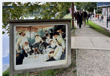
C'est une reproduction du tableau « Le déjeuner des Canotiers » d'Auguste Renoir qui est au point de départ du sentier