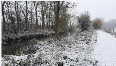
La Marque sous la neige, le 3 décembre 2023