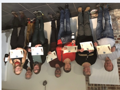
Ils sont sept à recevoir le titre de Jacquet.

Tout commence par une randonnée sous une pluie battante, le long des berges détrempées de la chaîne des lacs ! * Qu'à cela ne tienne... Dans le restaurant Quanta où se poursuit cette journée « Retour de Compostelle » organisée par Compostelle Nord, les capes ne sont plus utiles et on les laisse sécher à l'entrée.