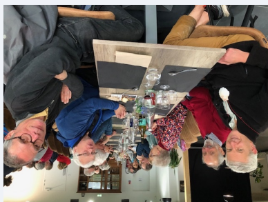
Bien à l'abri des pluies, le repas à Quanta

leurs très beaux et forts témoignages... Quelle riche journée que celle vécue le samedi 18 novembre dernier !