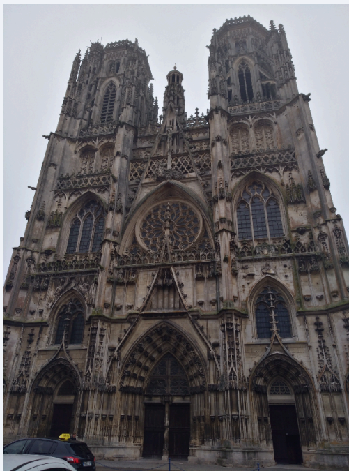
Cathédrale Saint-Étienne de Toul